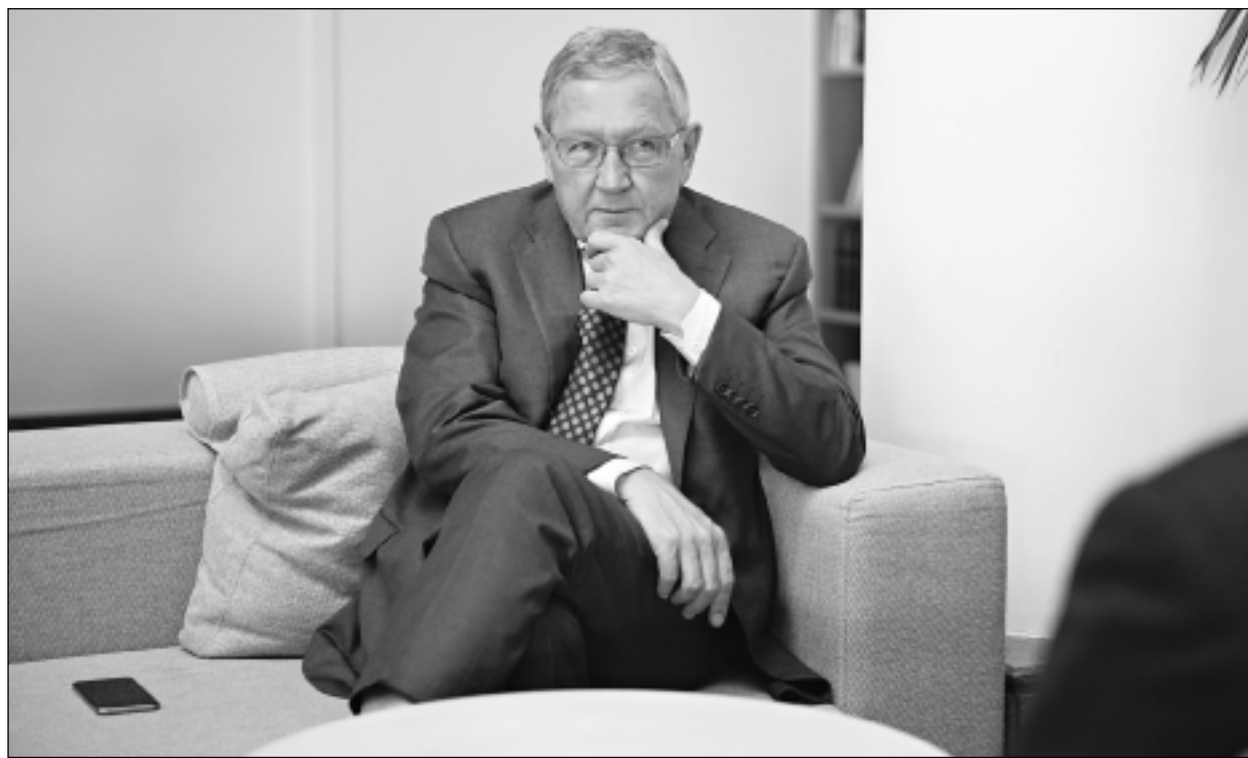
"Η πρόοδος είναι σαφής, ακόμη και αν δεν είναι μπορεί ο πληθυσμός να το αισθανθεί. Ενθαρρύνω την κυβέρνηση να συνεχίσει αυτό το έργο και να αντιμετωπίσει τα εναπομείναντα προβλήματα", τονίζει ο γενικός διευθυντής του Ευρωπαϊκού Μηχανισμού Σταθερότητας, Κλάους Ρέγκλιγκ.

Η Κύπρος έχει ήδη αρχίσει να επιστρέφει στις αγορές και το επόμενο έτος θα υπάρξουν περισσότερες εκδόσεις ομολόγων. Η χώρα δεν θα χρειάζεται να στηρίζεται, πλέον, από τον ΕSM. Εμείς παρέχουμε μόνο χρηματοδότηση έκτακτης