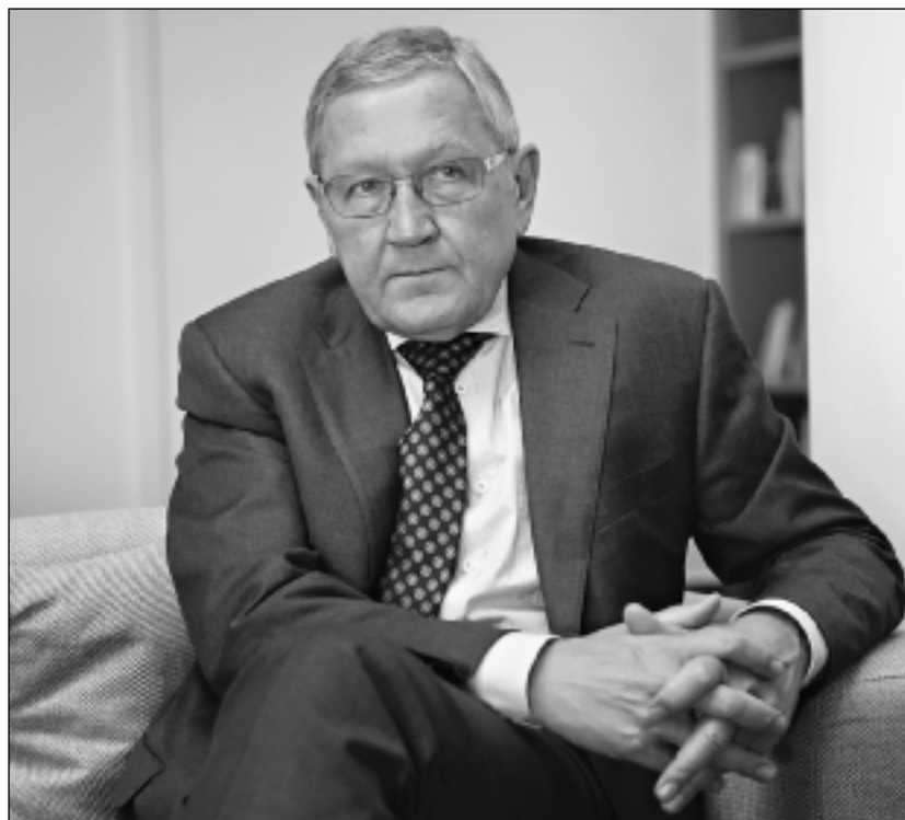
Δεν είναι τόσο σημαντικό αν αυτή θα είναι η τελική αξιολόγηση, σημειώνει ο Γερμανός αξιωματούχος. "Θα είμαστε σε στενή επαφή με την κυβέρνηση για πολύ καιρό ακόμη. Όλοι οι πιστωτές έχουν τους δικούς τους μηχανισμούς για να μείνουν σε επαφή με την κυβέρνηση", προσθέτει.

Αυτό είναι σωστό. Υπάρχει μια σχέση μεταξύ ενός μεγάλου ποσού μη εξυπηρετούμενων δανείων και της μειωμένης ικανότητας του τραπεζικού τομέα να παρέχει νέα δάνεια. Γι' αυτό είναι τόσο επείγον να αντιμετωπιστεί το πρόβλημα των μη εξυπηρετούμενων δανείων. Γνωρίζουμε, όμως, ότι αυτό απαιτεί κάποιο χρόνο. Η κυβέρνηση και το κοινοβούλιο υιοθέτησαν ένα νέο νομικό πλαίσιο για να αντιμετωπίσουμε καλύτερα το πρόβλημα των ΜΕΔ. Τώρα το θέμα είναι η εφαρμογή αυτού του πλαισίου, το οποίο είναι σχετικά νέο. Οι τράπεζες θα πρέπει να επωμιστούν κάποιες απώλειες και οι δανειολήπτες θα πρέπει, επίσης, να είναι έτοιμοι να έρθουν σε συμφωνία με τις τράπεζες. Όσο πιο γρήγορα εξελίσσεται αυτή η διαδικασία, τόσο πιο γρή-